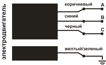
Рис. 4 Принципиальная электрическая схема